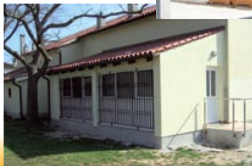
Uređen prostor za rad MO Vinkuran