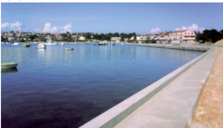
Obalni zid - prvi korak ka realizaciji rive