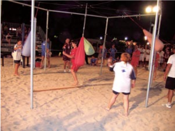
Igra spretnosti među vrećama

Etapna sportska natjecanja u sklopu igara "Šanpiero" i ove su godine pokazale kako je riječ o dobro osmišljenom organizacijskom pothvatu čijom je zahvalom opet pokrenuto takvo druženje mladih i onih koji sport shvaćaju kao dio svoga života. Kako je projekt bio i zamišljen na početku, u naseljima općine održavaju se sportske igre u kojima sudjeluju mještani ali i dio njihovih gostiju.