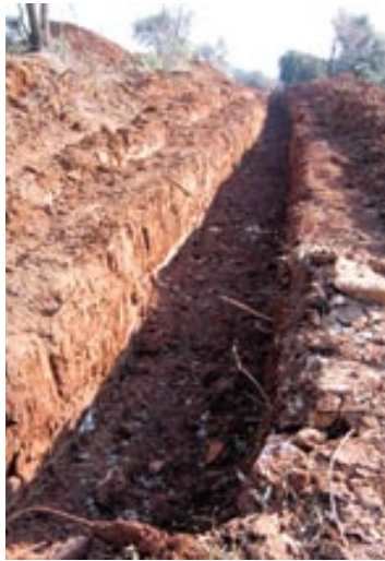
Radovi na trasi u Banjolama

Kao prioritet i preduvjet turističkog i gospodarskog razvoja, i prioritet svih prioriteta je izgradnja kanalizacije u svim naseljima Općine Medulin. Komunalnom poduzeću Albanež povjereni su svi poslovi vezani za pripremu i izgradnju kanalizacije u cijeloj općini. Slijedi pregled radova 2005.-2007.