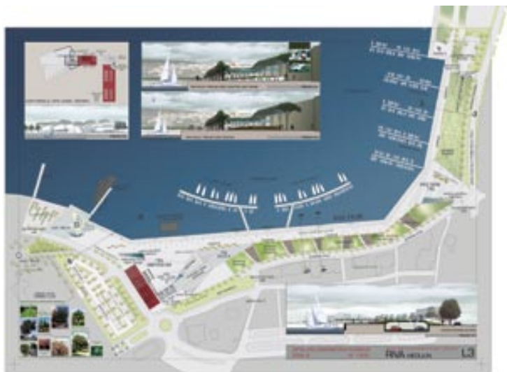
Idejno rješenje medulinske rive

Nakon skoro dva desetljeća postojanja općine Medulin, počela je realizacija jedne od najvećih želja svih mještana mjesta Medulin – pokrenuo se projekt medulinske rive. Za početak, napravljeno je idejno rješenje koje je osnova za daljnji razvitak ovog projekta, ali što je najvažnije od svega, predstavlja osnovu po kojoj mještani Medulina mogu raspravljati kakvu bi rivu ustvari željeli.