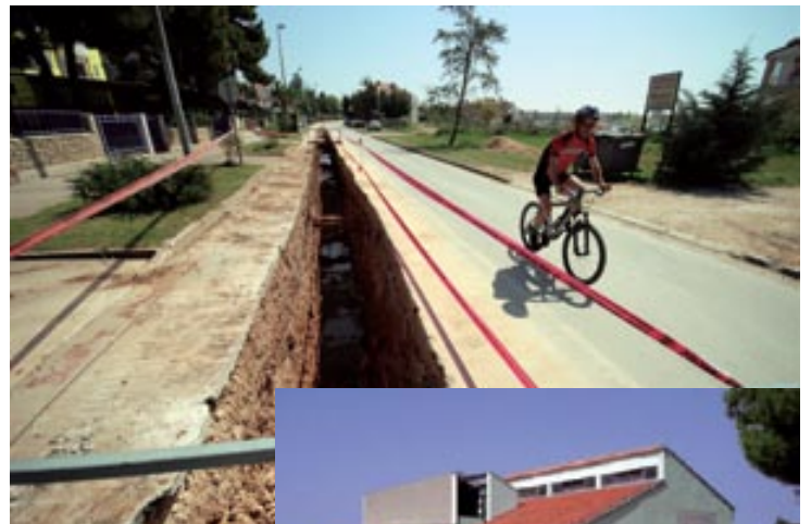
Radovi u ulici Sad - Medulin