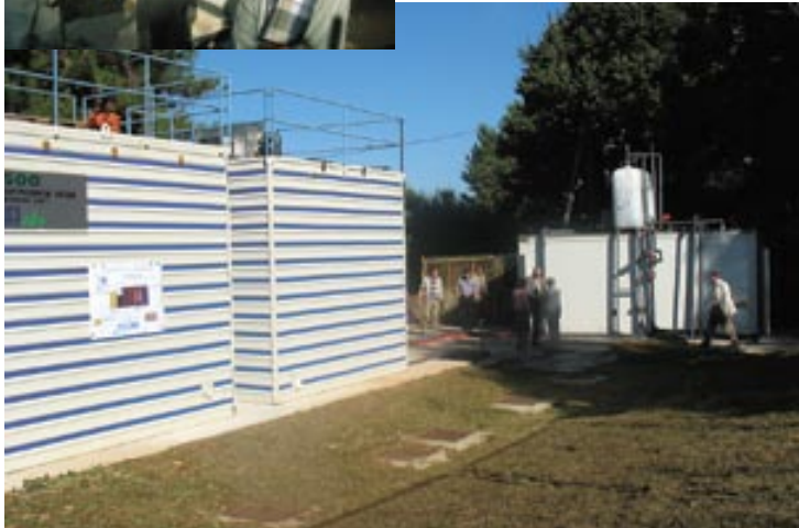
Pročištač u Premanturi