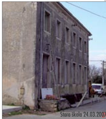
Stara škola 24.03.2007.

Nakon godina obećavanja, u proljeće 2007. Započela je izgradnja škola u Pomeru i Premanturi za što je utrošeno gotovo 4 milijuna kuna. Uz to, renovirane su i Premanturska i Pomerska plaća. Vinkuran je dobio novi prostor za rad mjesnog odbora.