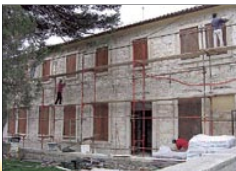
Radovi na školi u Premanturi