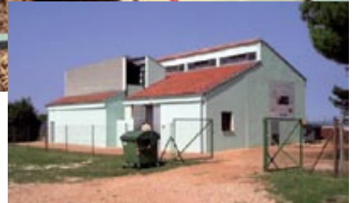
Primjer objekta koji utjelovljuje MBR uređaj