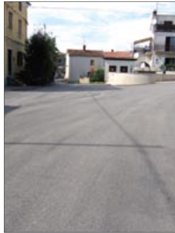
"Slani puč" u Medulinu