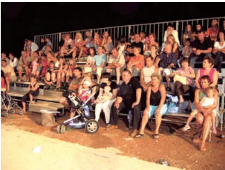
Brojna publika je na novim tribinama bodrila svoje sportaše