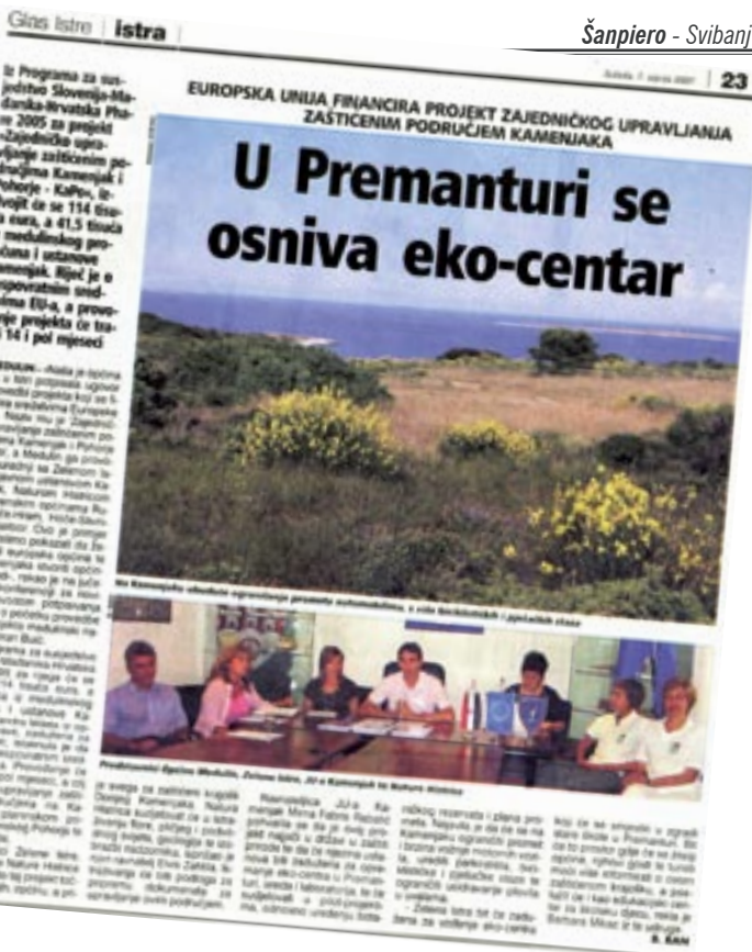
Srijeda, 5. srpnja 2006.

TISAK: MPS-Pula Naklada 2.200 kom. List je besplatan