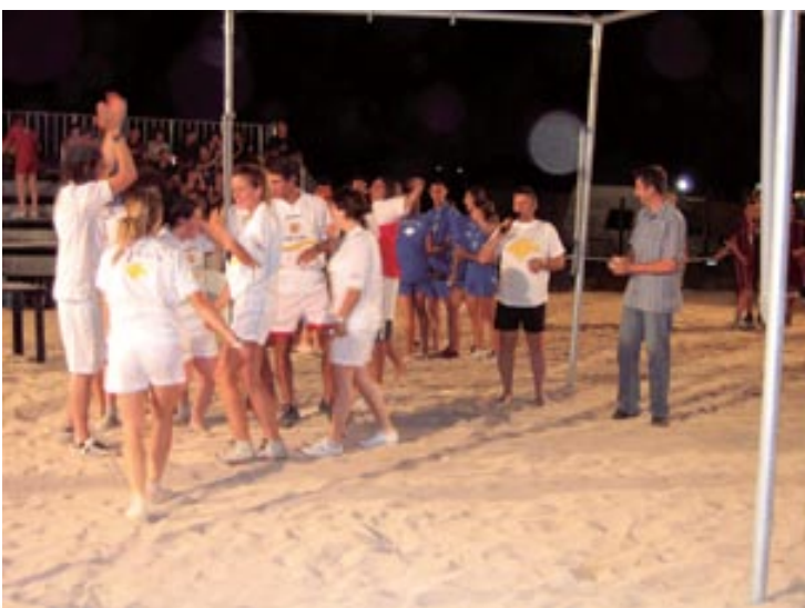
Domaćini su u Medulinu bili najbolji pa su tako i zasluženo zaradili medalje koje im je uručio općinski načelnik